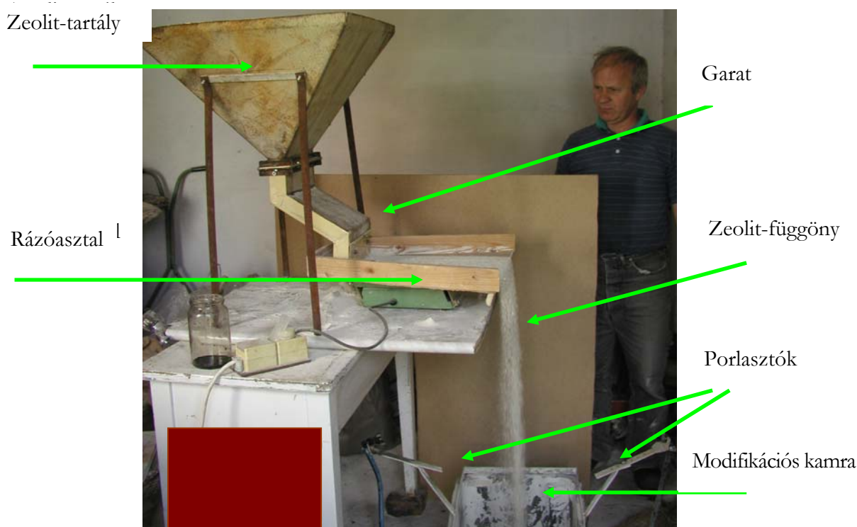
5. ábra Folyamatos üzemű zeolit-modifikáló berendezés