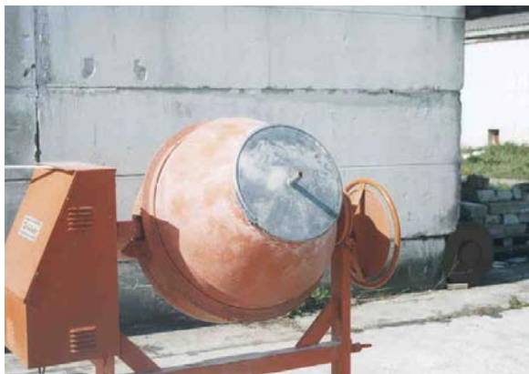
3. fénykép Modifikálószer rápermetezése a mozgásban tartott zeolitra