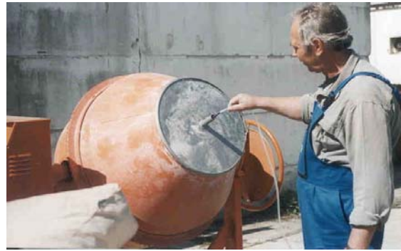
2. fénykép Porlasztófej behelyezése a betonkeverő fedelén kialakított csőbe