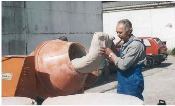
1. fénykép Természetes zeolit betöltése a betonkeverőbe