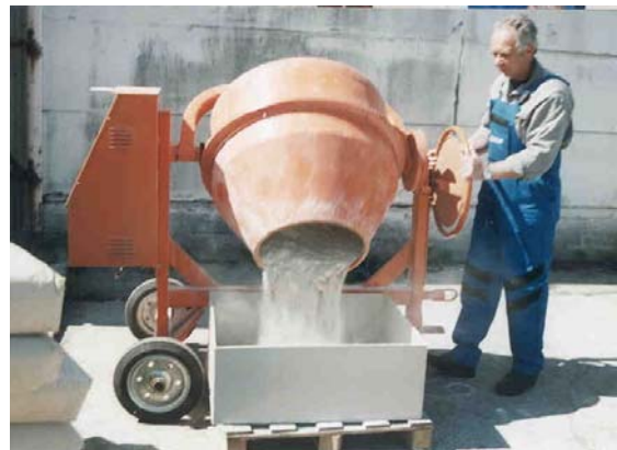
4. fénykép A felületkezelt zeolit eltávolítása a betonkeverőből